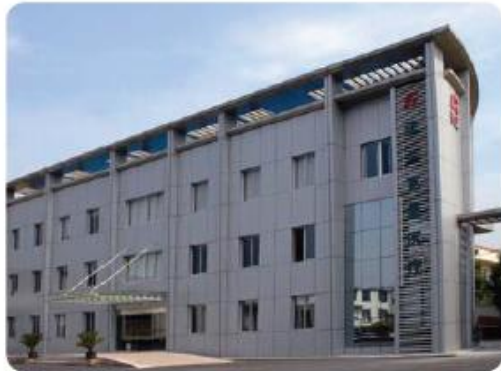
Instalaciones de fabricación

DISEÑO INFORMADO. ESCRUPULOSAMENTE APLICADO. METICULOSAMENTE PRODUCIDO.