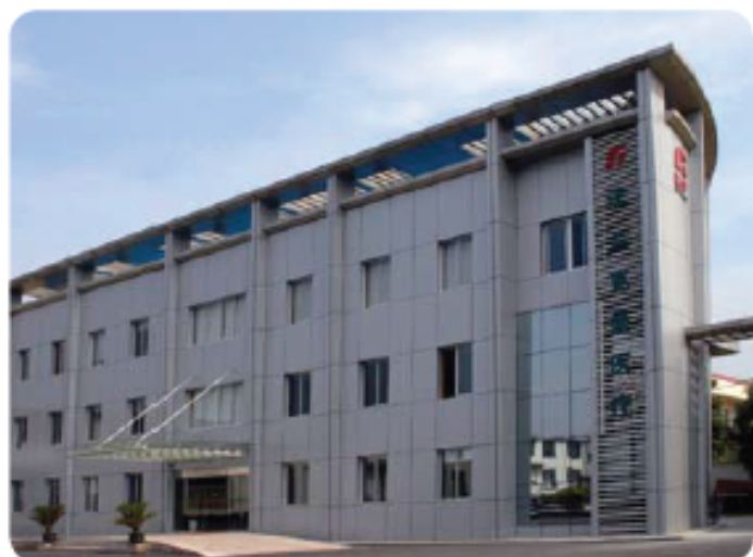
Instalaciones de fabricación

Por ello sabemos que somos capaces de ofrecer productos de alta calidad a los profesionales de la salud, tanto hoy como en el futuro.